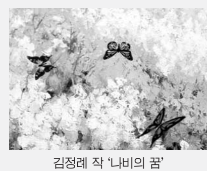
김정례 작 '나비의 꿈'

디지털로 만나는 나비의 아름다움. 순천대 영상디자인학과 학생들이 제13회 합평나비축제(29일~5월10일) 기간에 합평엑스포 공원 내 합평근린미술관에서 '나비의 꿈'전을 연다. 이번 전시에는 김아름·위상아·이민화·김정례·이태희·김수지·서승현·강선영·정라영·김미선·박누리·황지수씨가 참여해 나비와 꽃을 소재로 한 다양한 디지털아트를 선보인다. 꽃이 피고, 나비가 날아다니는 모습을 3차원으로 형상화했고, 형형색색의 컬러와 배경 음악을 곁들여 관람객의 오감을 자극한다.