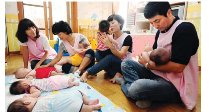
롯데백화점 광주점 및 고을나눔 봉사단은 2일 결연시설인 광주 영아원서 일시 보호소를 방문, 아기 돌보기와 식사보조, 청소활동 등 생활지원봉사를 펼쳤다.