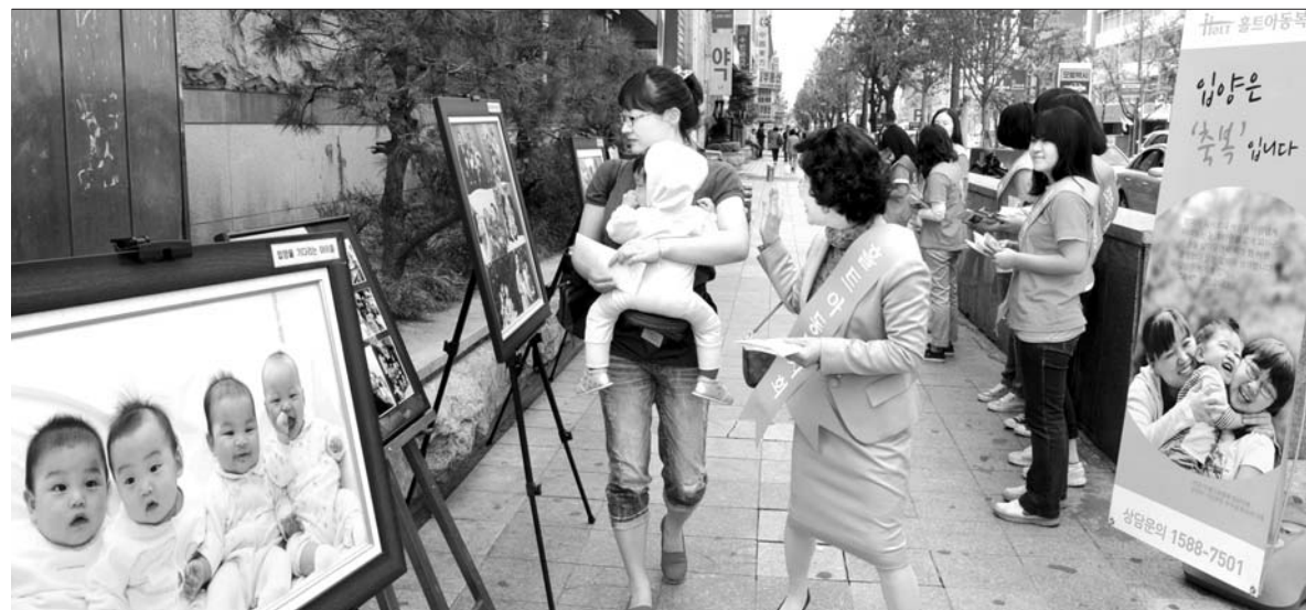
"입양은 가슴으로 낳는 사랑입니다"