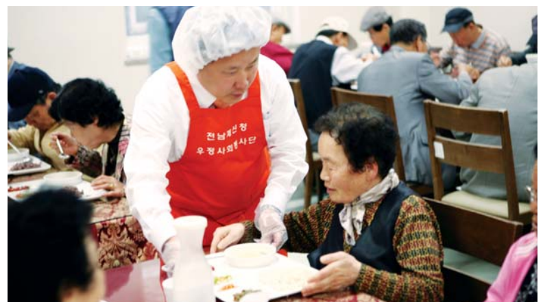
전남체신청은 최근 5월 가정의 달을 맞아 서구 노인종합복지관에서 지역 어르신 600여명을 모시고 ‘어른공경, 효사랑’ 행사를 진행했다.