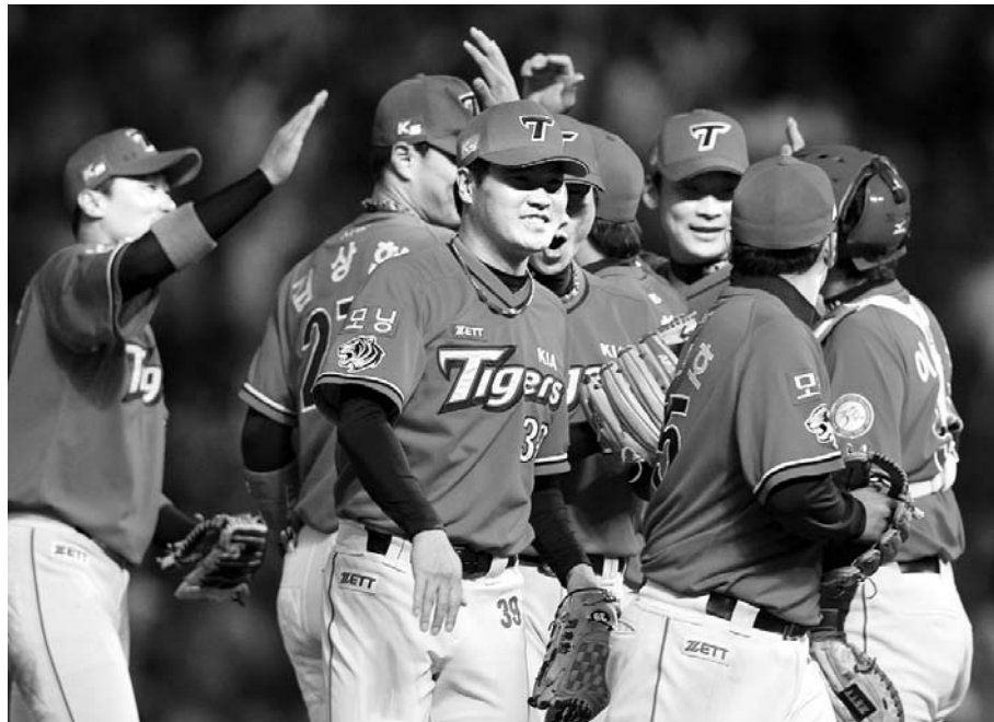
KIA 타이거즈 선수들이 8일 문학구장에서 열린 SK와이번스와의 시즌 5차전에서 연장 11회 말 '끝내기 삼중살'이라는 기적을 연출, 2-1로 이긴 뒤 지축하고 있다.

KIA는 한국시리즈 V10이라는 대기록만 큼이나 많은 전기기록을 보유하고 있다. 월간 최다승(20승), 프로야구 최초 한 이닝 한 타 이클링 홈런, 사상 첫 1박2일 연장승부, 역대 최장시간 승부(5시간58분). 두산과의 홈경기 가 예정됐던 지난해 4월14일에는 타이인 '춘살(春暑)에 프로야구 사상 처음으로 눈