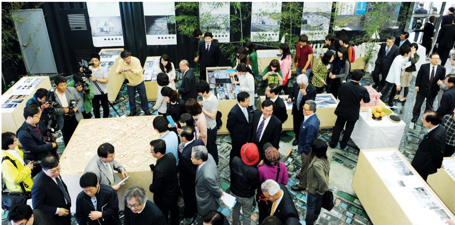
12일 '콘스트랄레' 광주에서 시민과 학생들이 광주 도심에 장식할 어번폴리 모형을 둘러다 보고 있다.