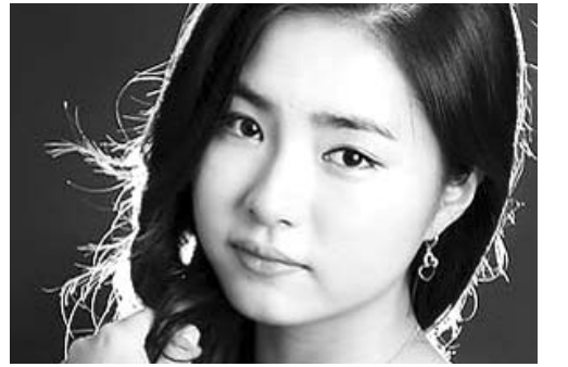
마쳤으며 현재 공중역선 블록버스터 '비상 : 태양 가까이'를 촬영 중이다.

말문이 트이게 되고, 특유의 영민함과 속 깊은 성격으로 세종의 총애를 받게 되는 인물이다. 이장명 작가의 동명 소설을 원작으로 한 '뿌리깊은 나무'는 세종대왕의 훈민정음 반포를 놓고 벌어지는 사건을 다룬다. 앞서 세종대왕 역에 한석규, 노비 출신의 검사 북 관원 채운 역에 장혁이 캐스팅됐다. 한편, 신세경은 최근 영화 '푸른 소금'의 촬영을