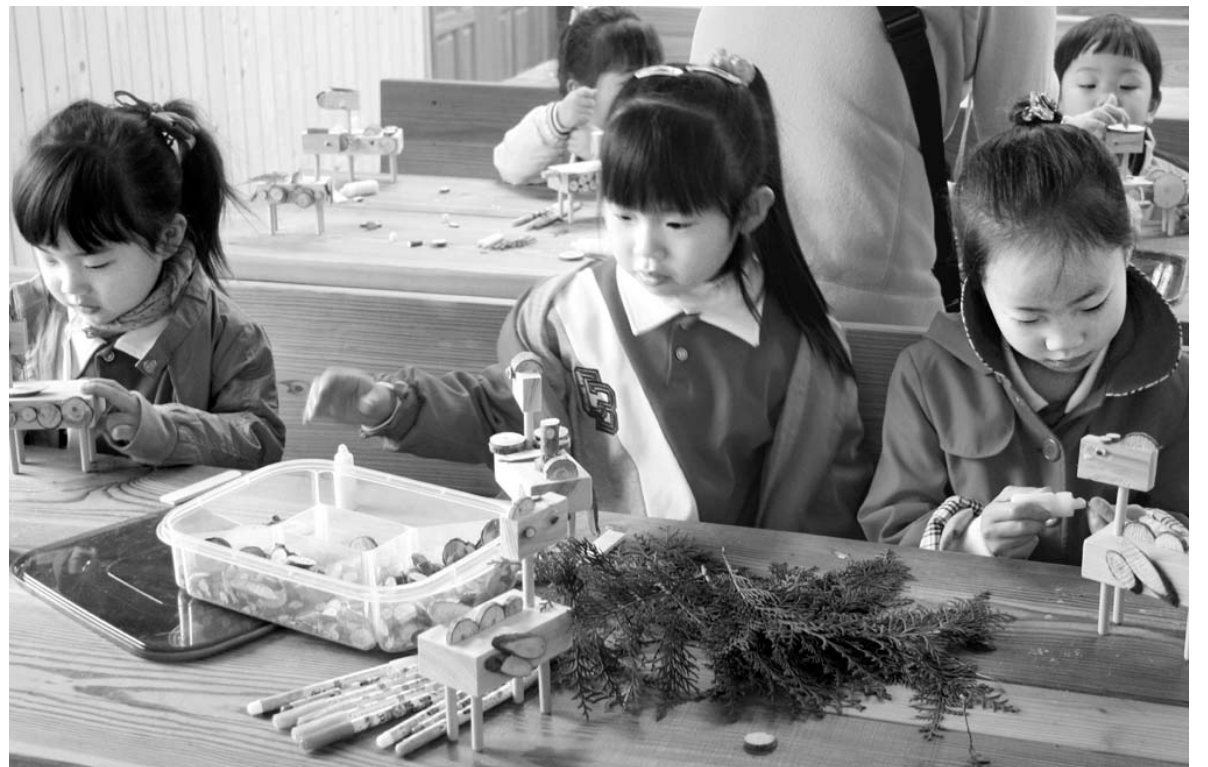
편백나무 장난감 만들기

고흥군은 지난 26~27일 이틀간 한국철도공사 서울, 경기, 부산 등 지역본부 여행상품 개발매니저와 관광여행사 대표 등 40명을 초청해 팸투어를 실시했다. 이번 행사는 오는 9월 개 KTIX 전곡역대 개통에 대비, 철도관광객 유치를 위해 마련됐다. 이번에 실시한 팸 투어는 우주센터, 천문과학관, 소록도 등 그동안 보고 지나가는 단순관광에서 갯벌체험, 편백소 탐방, 다도해 해상관광을 비롯한 고흥의 9가지 맛기행 등 다양한 관광코스를 선보였다. 군은 다양한 인센티브를 제공할 예정이다. 팸투어 참가자들은 “최근 관광형태는 자연생태 중심의 체험 관광”이라면서 “고흥은 볼거리, 먹을거리, 즐길거리와 체험이 가능한 관광자원들이 무궁무진하다”고 입을 모았다. /동부취재본부=주각중기자