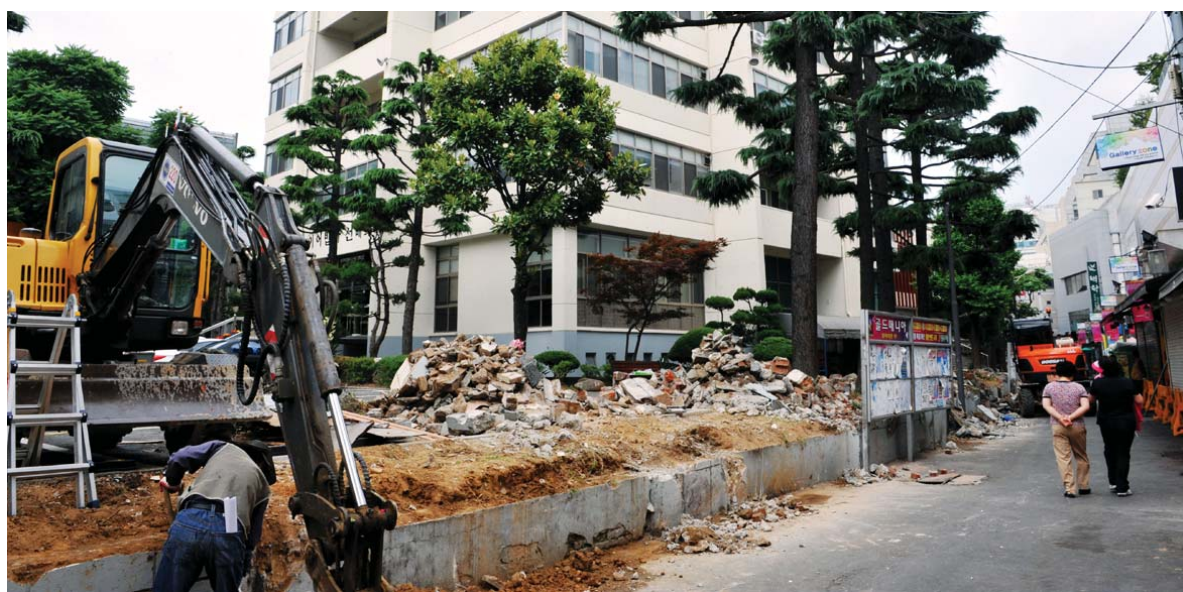
푸른 학생독립운동기념관 시동 물고 있다.