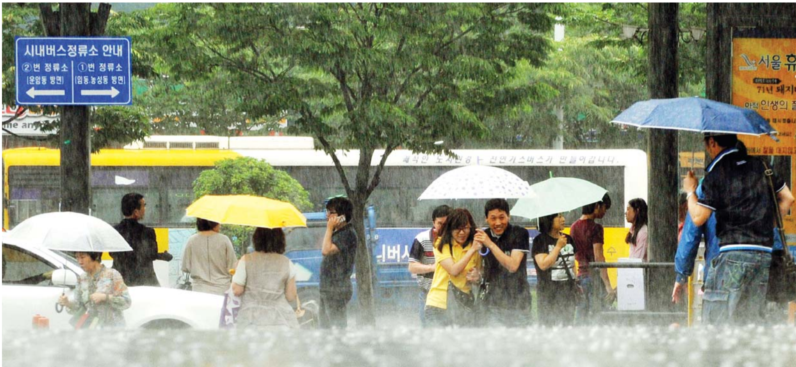
장마 시작 남부지방에 여름 장마가 예고된 9일 오후 광주시 서구 광천동 버스종합터미널에서 행인들이 갑작스레 퍼붓는 비를 피해 우산을 쓴 채 발걸음을 서두르고 있다.