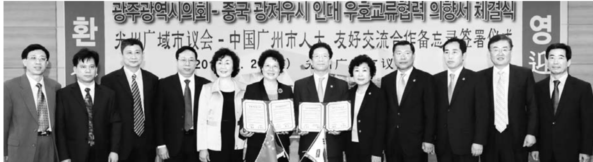
광주시의회-광저우시 상무위 우호교류 협력 광주시의회 의장단과 중국 광저우시 양우 부주 임 등 인민대표대회 상무위원회는 21일 오전 시의회 4층 대회의실에서 양 도시의 공동 발전을 위한 우호교류협력을 맺고 의향서를 교환했다.