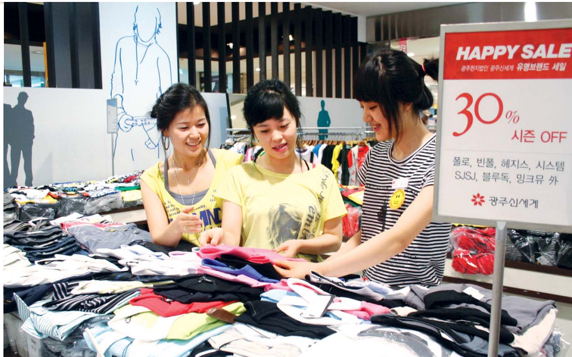
23일 광주 신세계백화점이 정기 세일에 앞서 개최한 유명브랜드 시즌오프 행사에서 고객들이 의류매장을 둘러보고 있다.

여름 휴가를 준비하는 수요를 겨냥해 특가 및 이월상품을 최대 70%까지 할인 판매하는 기획전과 행사를 마련했다. 4층 행사장에서는 라인 티셔츠 2만9000원, 스커트 4만9000원, 원피스 6만9000원, 잇미샤 원피스·재킷 각 6만9000원, 오조크 티셔츠 2만4000원에 판매된다. 8층 행사장에서는 패션샌들·비치웨어 특집전으로 슈어홀릭 페스티벌, 비치웨어 페스티벌 등 다양한 여름상품 행사를 준비했다.