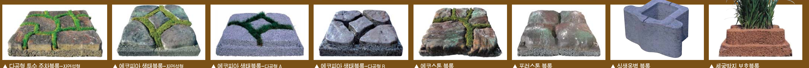
▲ 다공형 투수 주차블록-자연석형 ▲ 에코피아 생태블록-자연석형 ▲ 에코피아 생태블록-다공형 A ▲ 에코피아 생태블록-다공형 B ▲ 에코스톤 블록 ▲ 포러스톤 블록 ▲ 식생옹벽 블록 ▲ 세굴방지 보호블록