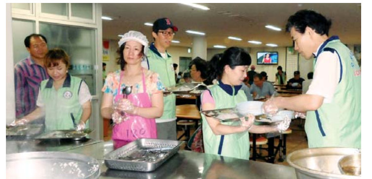
광주우체국 봉사활동 동호회 ‘사랑나눔봉사회’는 최근 광주시 남구 서동 ‘사랑의 쉼터’를 찾아가 봉사활동을 했다.