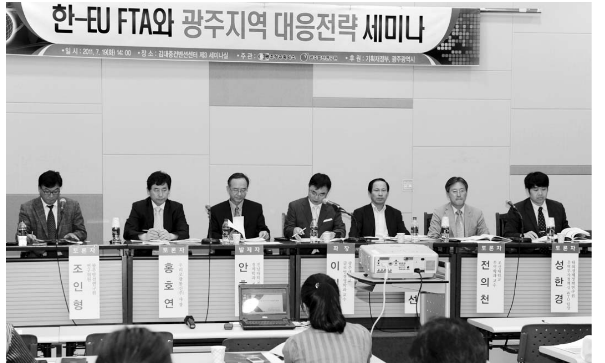
광주상공회의소와 광주발전연구원은 19일 광주 김대중컨벤션센터에서 '한-EU 자유무역협정과 광주지역 대응전략 세미나'가 열렸다.