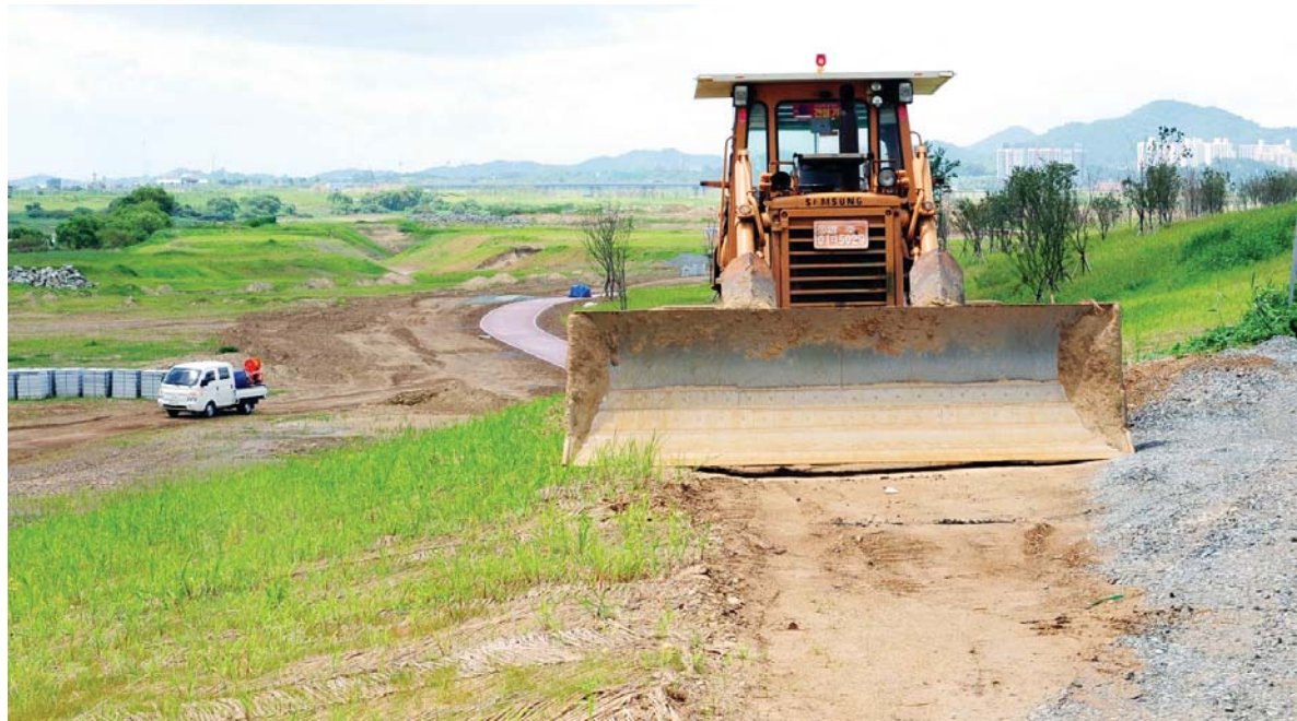
28일 중장비 업체들이 나주 노안면 일대 영산강 살리기 사업 5공구 공사 현장(생태공원 조성 사업구간)에 불도저를 세워 다른 중장비 진입을 차단하고 있다. 이들은 지난 22일부터 체불 해소를 요구하며 공사를 중단했다.