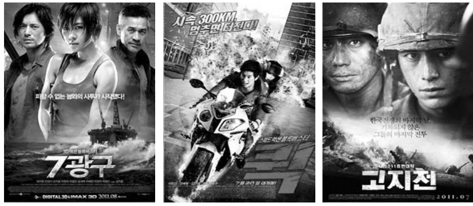
7광구 퀵 고지전

이 같은 국내 굴지의 CG 업체 진출과 그에 따른 성과는 광주시의 '문화산업 투자진흥지구' 지정, CGI(Computer Generated Image)