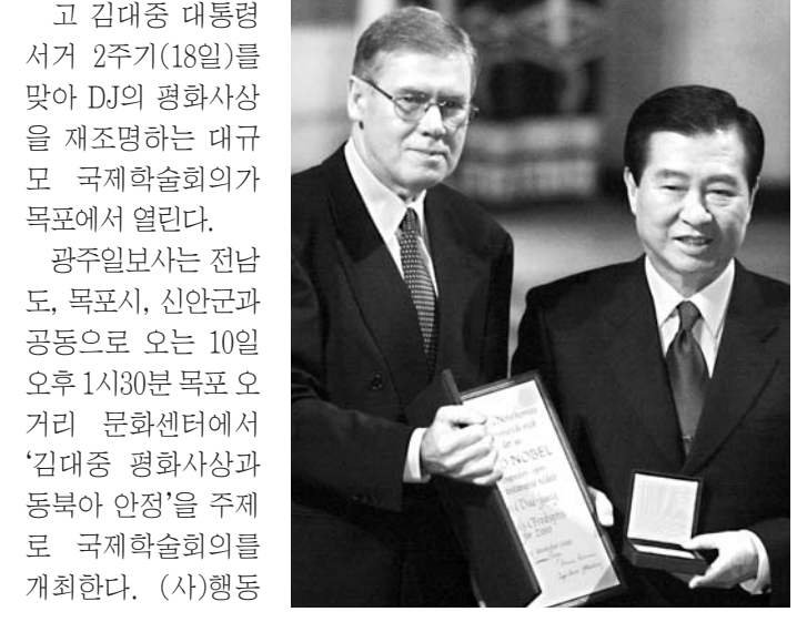
오후 1시30분 목포 오거리 문화센터

고 김대중 대통령 서거 2주기(18일)를 맞아 DJ의 평화사상을 재조명하는 대규모 국제학술회의가 목포에서 열린다. 광주일보사는 전남도, 목포시, 신안군과 공동으로 오는 10일 오후 1시30분 목포 오거리 문화센터에서 '김대중 평화사상과 동북아 안정'을 주제로 국제학술회의를 개최한다. (사)행동