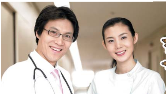
건강관리 개인맞춤형 자연면역 치유센터