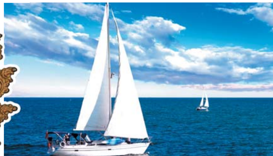
고품격 문화·레저 요트, 승마, 골프 등