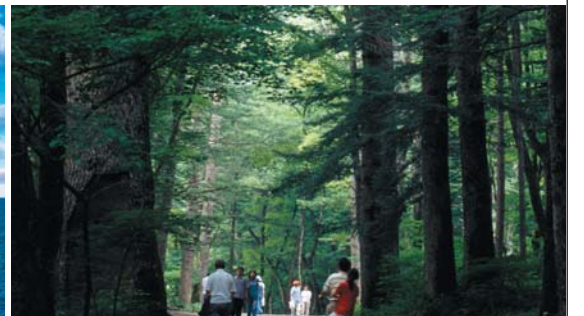
최적의 자연환경 축령산 편백나무 숲, 게르마늄 온천