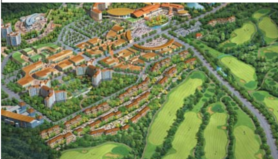
석정온천관광지 웰파크시티 1,503,252㎡ (구)45만평

* 사용된 이미지는 소비자의 이해를 돕기 위한 것이며, 도면과 조감도의 내용은 일부 수정될 수 있음.