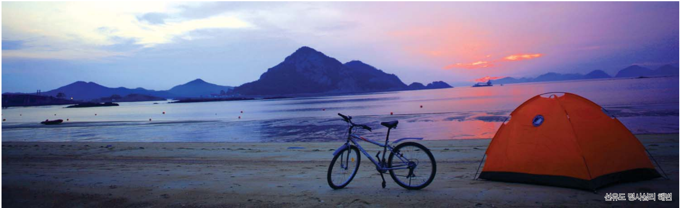
선유도 명사십리 해변

파도소리 바람소리 벗삼아서 보내는 '섬에서의 하루'만큼 매력적인 여름 낭만이 있을까? 한국관광공사가 추천하는 8월의 섬. 남해의 파라다이스 거제, 낙조가 아름다운 선유도, 역사·자연체험까지 할 수 있는 강화도를 소개한다.