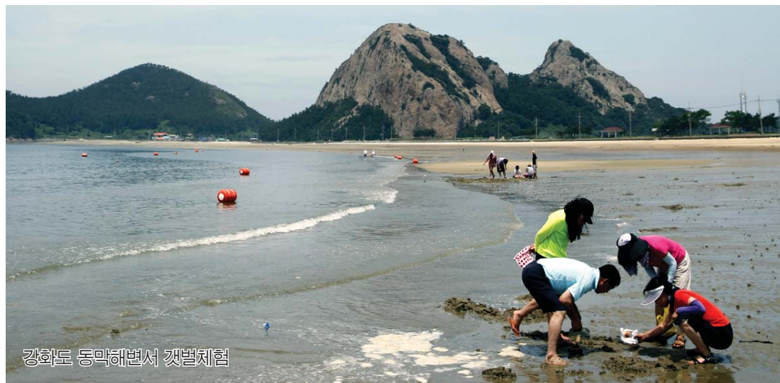
강화도 동막해변서 갯벌체험