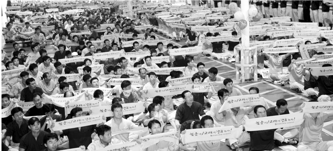
을 기아차 임금협상은 노조 집행부 선거와 맞물리면서 장기화 우려가 높다. 지난 2009년 역대 최장·최대·최다 파업 사태 때와 상황이 비슷하기 때문이다. 사진은 2009년 기아차 노조의 파업 출정식.