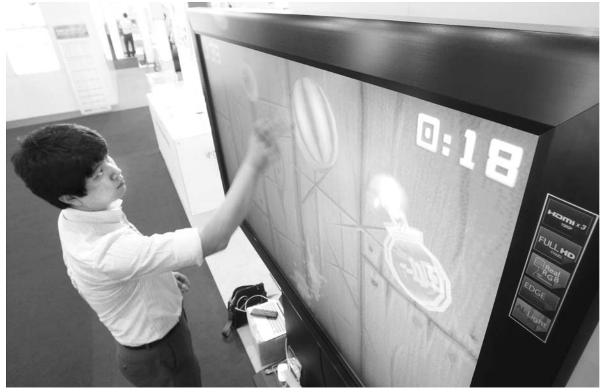
72인치 터치스크린 시연

년 6777가구, 2000년 7935가구로 폭 떨어졌다. 2002년 2만835가구에서 글로벌 금융위기 여파로 2008년 3945가구, 2009년 5024가구로 급감했다. 광주시 관계자는 "이들 중 상당수 업체가 이미 사무실이 비어있거나 연료가 안 되는 무늬만 업체였다"며 "주택건설경기가 살아날 기미가 없자 업체를 유지할 필요성이 없어진 것이 대규모 등록말소의 원인으로 추정된다"고 말했다. /원천석기자 chadol@kwangju.co.kr /박정욱기자 jwpark@kwangju.co.kr