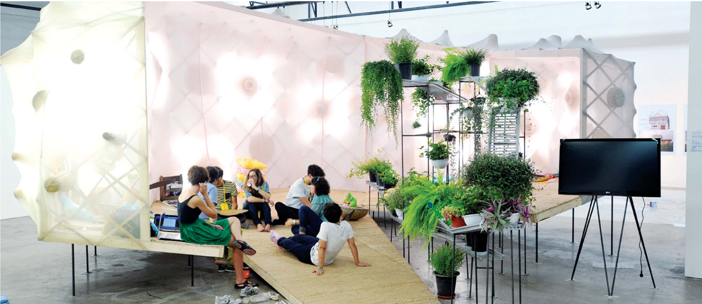
30일 비엔날레 전시관에서 관계자들이 출품작 '즐거운 나의 집'을 둘러보며 이야기 나누고 있다.