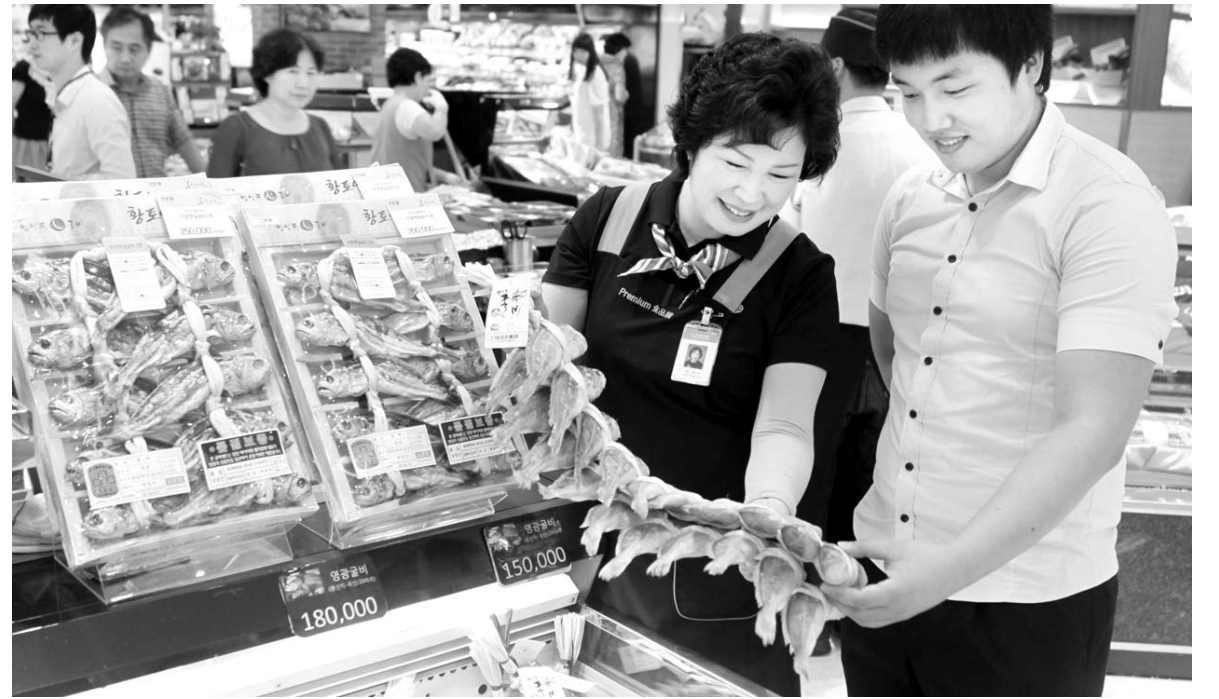
“영광굴비” 선물세트 인기 4일 롯데백화점 광주점 지하 1층 식품매장에서 한 고객이 추석선물로 인기인 ‘영광굴비’선물세트를 구경하고 있다.

기관의 공사발주 물량이 크게 줄어든 데다 정부 예산이 복지분야 등에 집중 투입되고 있기 때문으로 분석된다. 이에 따라 건설업계는 지역 건설경기 회복을 위해 최저가낙찰제 기준을 현재 300억원 이상인 100억원으로 확대하려는 정책을 철회해 줄 것을 정부에 강하게 요구하고 있다. 대한건설협회 광주시회 관계자는 “최저가낙찰제는 업체 간 물량 확보를 위한 과당 경쟁과 저가 수주를 야기하는 등 많은 부작용을 낳고 있다”며 “이를 100억원 이상으로 확대할 경우 전체 공공공사 물량의 10%인 7조8000억원에 달해 지역 중소기업체는 줄도산을 면하지 못할 것”이라고 지적했다. /*박정욱기자 jwpark@kwangju.co.kr