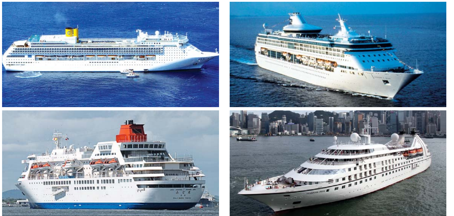
내년 여수세계박람회 기간 여수항에 입항기로 한 세계적 선사들의 유람선. 왼쪽 위부터 시계방향으로 이탈리아 코스타크루즈의 '코스타빅토리아호', 미국 로열캐리비안크루즈의 '레전드 오브 더 시즈', 중국 동방신륙크루즈의 '동방신륙호', 일본 재팬크루즈의 '후지마루크루즈호'