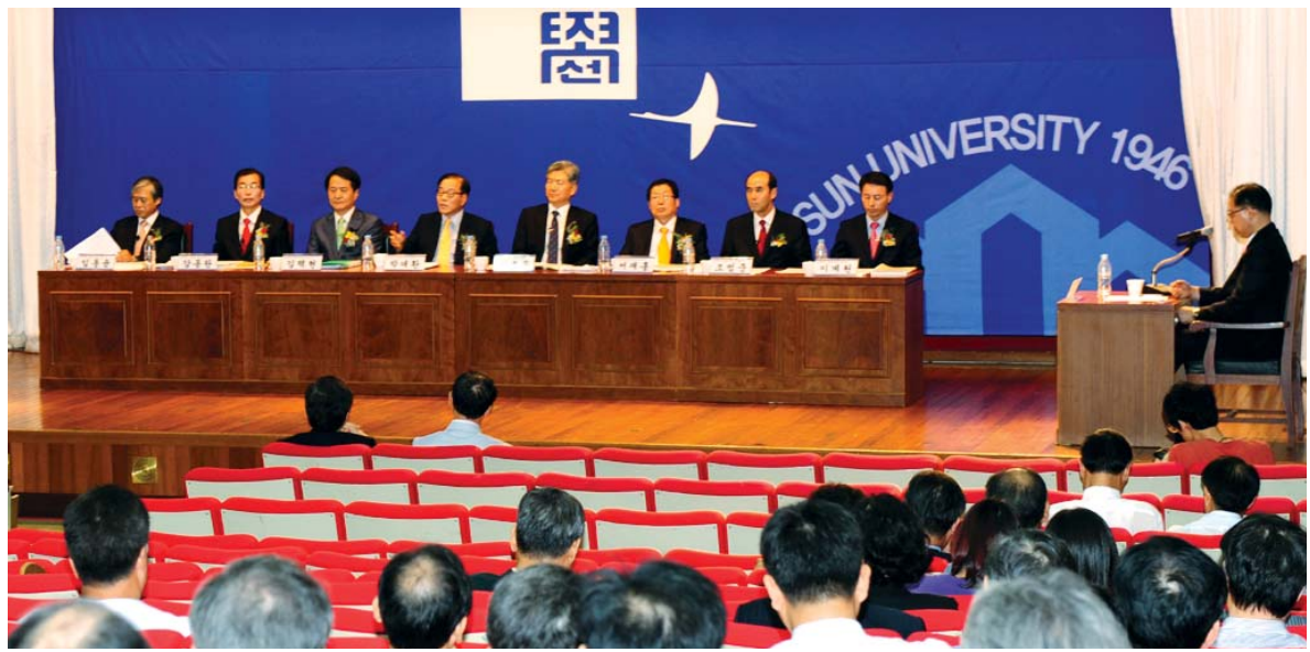
조선대 총장 후보 토론회

5일 조선대학교 자연과학대학 대강당에서 300여명의 교수와 직원, 학생들이 참가한 가운데 '제14대 조선대 총장 후보자 정책토론회'가 열렸다.