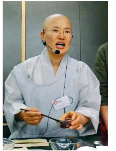
산 금수암 주지이며, '식탁위의 명상' '열두달 절집 밥상' 등의 책을 냈다. 문의 062-613-5392