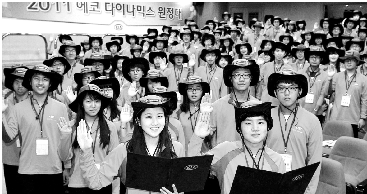
기아차 에코다이내믹스 원정대 발대. 지난 24일 서울 압구정동 국내영업본부 사옥에서 청소년 원정대원과 대학생 멘토, 기아차 및 유엔환경계획 한국위원회 관계자들이 모여 '2011 에코다이내믹스 원정대' 발대식 기념사진을 찍고 있다.