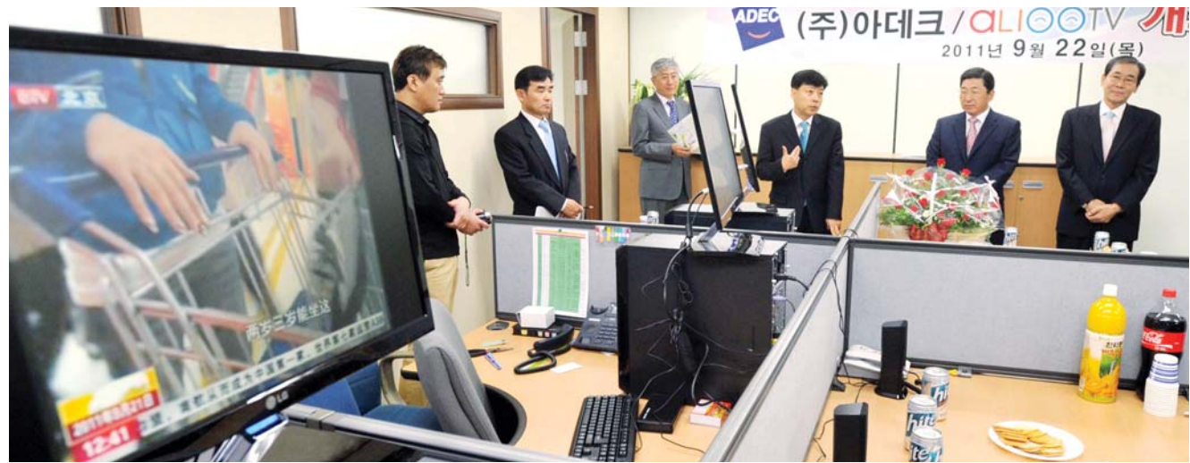
신개념 마케팅 서비스 업체인 (주)아데크가 지난달 22일 오전 광주시 동구 무등빌딩에서 개소식을 갖고 본격적인 알리오TV(www.alio.tv) 서비스를 시작했다.

비용은 기존 TV나 신문 광고의 100분의 1수준에 불과하다. 파워포인트 자료를 활용한 스탠다드 서비스(Standard Service)는 월 2만원, 홍보 동영상과 파워포인트 자료를 함께 활용하는 실버 서비스(Silver Service)는 월 5만원이다. 실버서비스와 함께 중국에서도 제공되는 골드 서비스(Gold Service)는 월 10만원이다. 문의 062-223-5111.