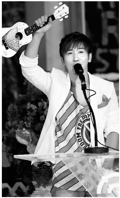
그러면서 “카메라 앞에 진정성이라 없다”며 카메라 없는 길거리 공연의 매력을 강조했다.

하지만 거꾸로 즐겁지 않은 공연일 수록 (행사비를) 확 질러버린다”고 했다. 이런 그를 보고 옆에 있던 절친 유상무가 “진짜 즐긴다”며 “돈이 목적이 아니라, 공연장을 갔을 때 너무 즐겁게 한다”며 맞장구를 쳤다. 유세윤, 유상무와 개그팀 웅담삼으로 활동하는 장동민은 “세운이가 여유가 있어서 그런 것”이라고 나름의 해석을 내놓았다. 유세윤은 “우리나라는 그런 게 있는 것 같다”며 “뭔가 원하는 것 같으면 그걸 안 준다. 인기를 원하는 것 같으면 인기를 안 준다”며 고개를 끄덕였다.