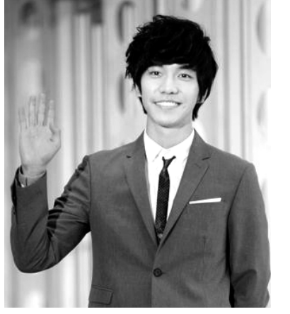
'강심장' 단독 진행을 맡은 이승기

지난 7월 첫선을 보인 SBS '힐링캠프, 기쁘지 아니한가'는 야외에 마련된 '일일 힐링캠프'에 좋아하는 요리 만들기, 맨발 걷기 등 치유 이벤트를 통해 편안한 분위기에서 게스트의 이야기를 이끌어 낸다.