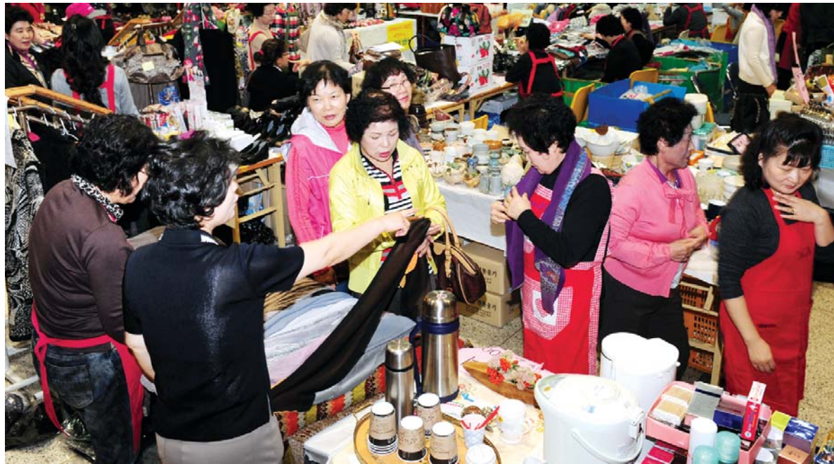
'Y가을 큰 장날' 광주 YWCA는 19일 회관 1층에서 지역에서 생산한 웰빙 제조식품과 농수산물, 의류 및 생활용품 등을 판매하는 'Y가을 큰 장날' 행사를 가졌다. 이 행사는 20일까지 이어지며, 행사 수익금은 여성권익보호·소비자보호운동 등에 쓰인다.