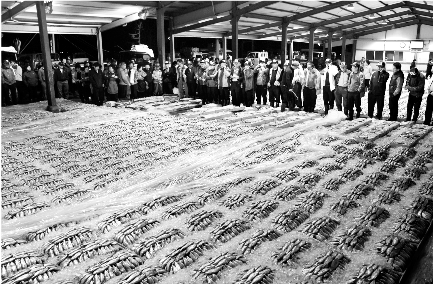
목포수협 위판장이 참조기로 가득차다. 계속되는 서해안 조기 풍어는 해경의 중국어선 불법조업 감시와 단속이 한몫하고 있다.