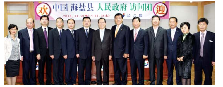
장흥군 국제 우호도시인 중국 절강성 해염현 방문단이 최근 장흥군을 방문해 우드랜드와 토요시장, 보림사 등을 둘러보고 양국의 상생발전 방안을 논의했다.