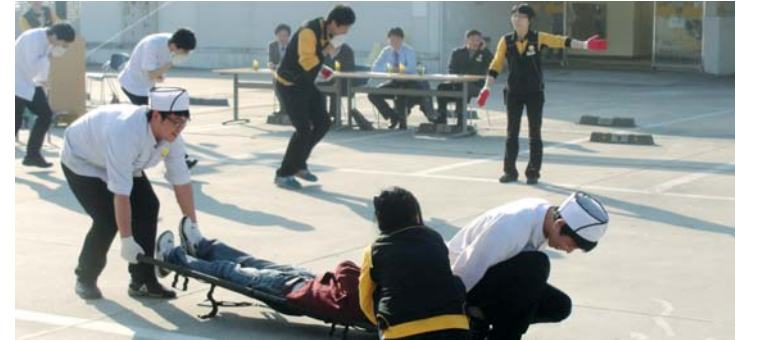
광주 E-마트 광산점은 최근 4개팀이 참여한 가운데 직원들의 안전의식을 고취시키기 위한 ‘동절기 화재예방 소방경진대회’를 개최했다.