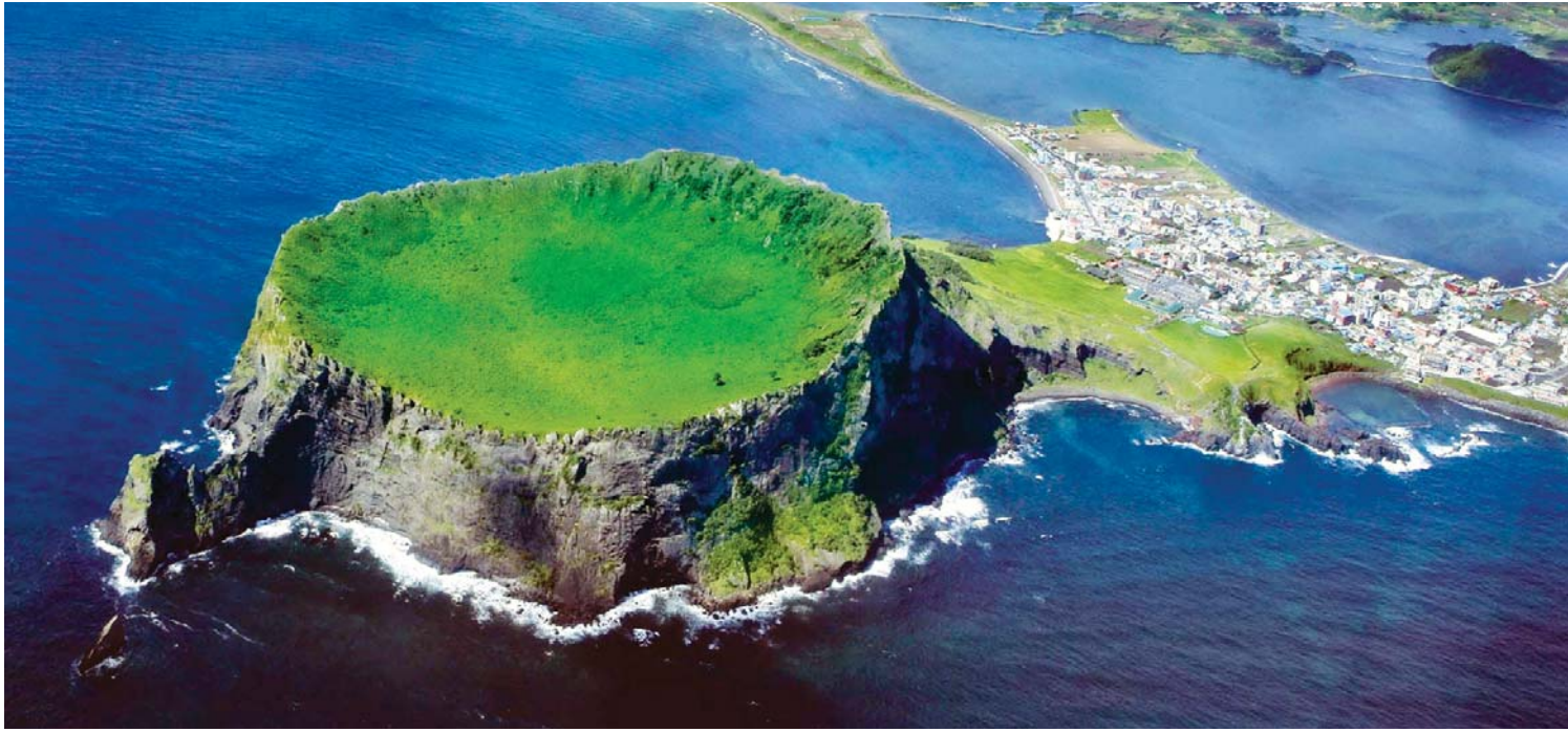
스위스 비영리 재단인 '뉴세븐원더스'가 주관하는 세계 7대 자연경관에 선정된 제주도의 빼어난 자연경관의 하나인 성산일출봉.