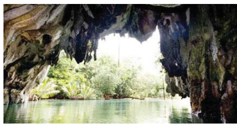
필리핀 푸에르토 프린세사 지하강

◇뉴세븐원더스 재단=스위스 출신 캐나다인인 버나드 웨버(Bernard Weber)가 창설한 비영리 재단으로 스위스에 본부를 두고 있다. '우리의 유산은 우리의 미래(Our heritage is our future!)'라는 구호 아래 세계의 유적을 관리, 보존할 목적으로 2001년 5월 설립됐다. 재단은 1999년부터 2007년 7월까지 전 세계 1억명이 인터넷과 휴대전화로 투표한 결과를 종합해 '신 세계 7대 불가사의'로 선정된 바 있다. '세계 7대 자연경관'은 이 재단이 2번째로 진행한 프로젝트다.