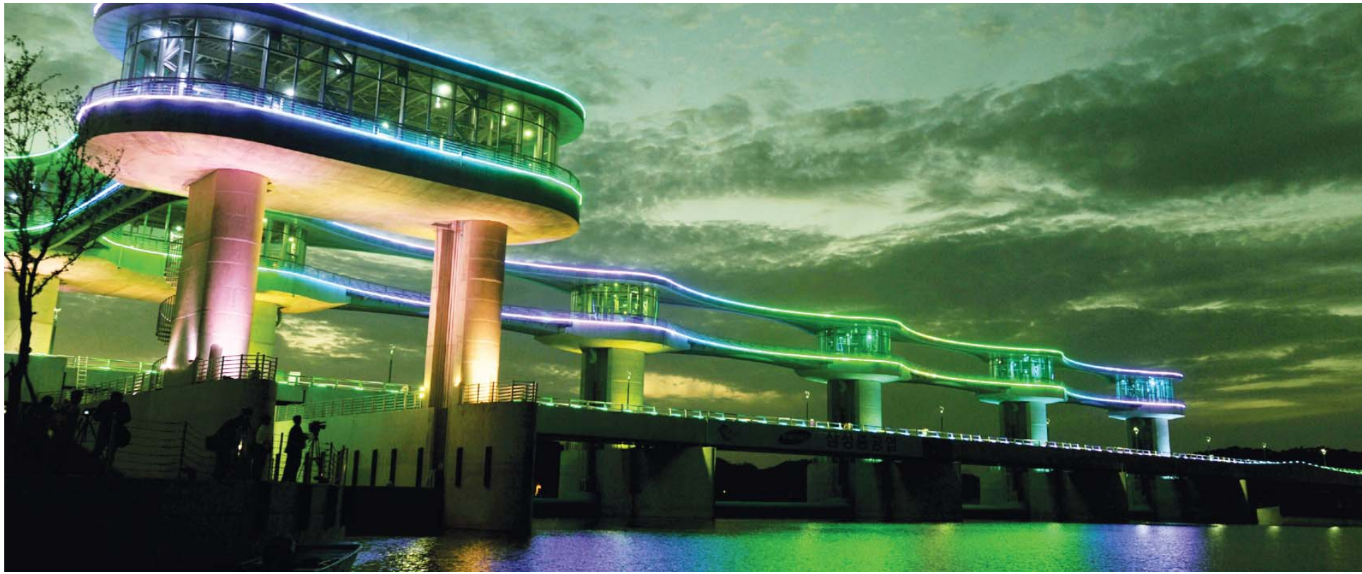
최근 개방행사를 연 죽산보 야경. 죽산보는 홍수시 수량을 조절할 수 있는 가동보(184m)로, 전국 16개 보 중 유일하게 배가 드나들 수 있는 통선문을 설치했다.