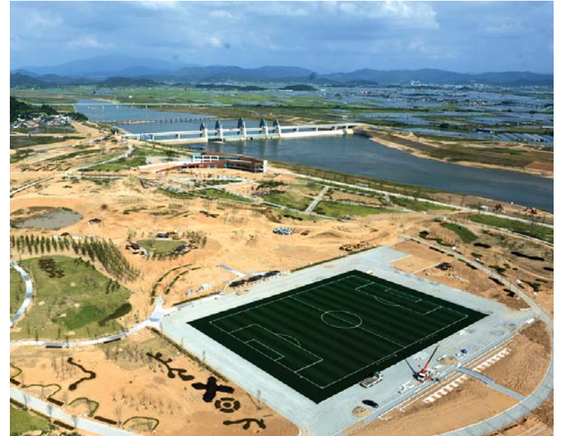
광주시 남구 승촌보(泮·댐) 전경.고정보(固定泮)와 수문을 열고 닫을 수 있는 가동보로 구성되어 있으며 주변에 체육시설과 생태습지 등이 조성돼 있다.

보 건설로 인한 수량 증대 효과도 가시화되고 있다. 익산청은 "사업 전보다 물그릇이 11배나 커지게 돼 가뭄에도 대비할 수 있게 됐다"고 밝혔다. 물론, 사업 준공 시기가 2012년 말이라는 점에서 홍수위가 낮아졌다고 말하기는 성급하다거나 준설을 마친 분류 구간에 흙이 다시 쌓이는 현상도 발생하고 있다는 반론도 적지 않다. /김지을기자 dok2000@kwangju.co.kr