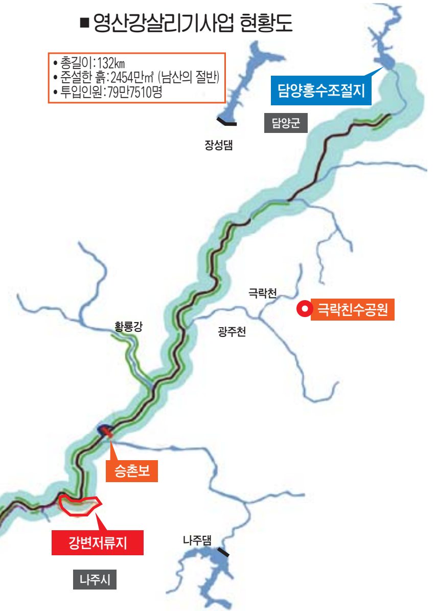
영산강 살리기 사업비