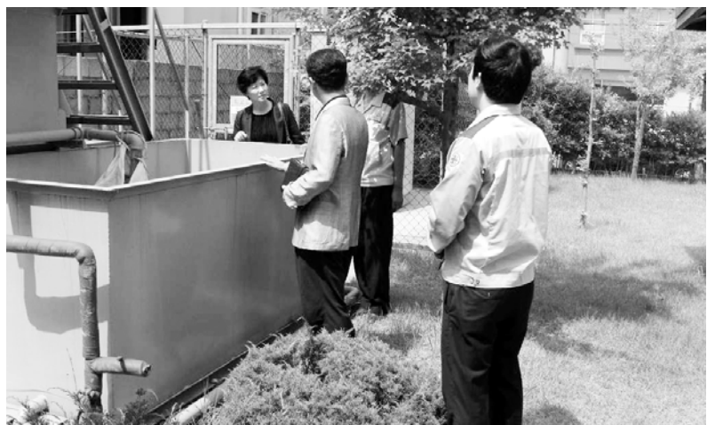
광주시청 환경정책과 직원들이 최근 오염물질 배출 업체들을 상대로 불법 배출 여부를 조사하고 있다.

구축해 3국의 환경협력 기반을 다지는 계기가 됐다. 이번 교육은 크게 한·중·일 3국의 강, 그룹토의 및 발표, 현장견학 등으로 구성되고, 강의 및 그룹토의는 '녹색성장 교육 및 녹색생활 실천 전략'과 '녹색기술 개발 및 녹색산업 육성 방안' 2가지 소주제로 나눠 진행된다. 국립환경인력개발원 관계자는 "이번 교육을 통해 우리나라의 녹색성장 비전 및 정책을 일본·중국과 공유함으로써, 동북아 3국이 환경보전과 경제발전이라는 두 마리 토끼를 동시에 잡는데 도움이 될 것으로 기대한다"고 말했다. /김경인기자 kki@kwangju.co.kr