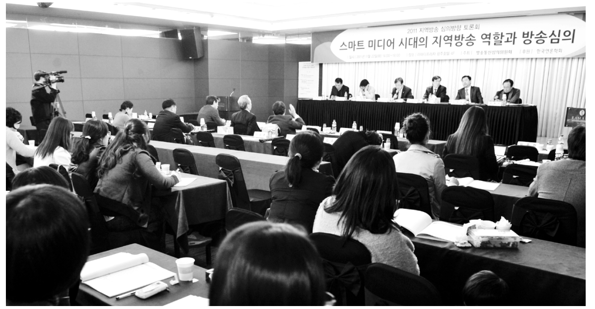
22일 광주 서구 치평동 라마다 호텔에서 열린 '스마트 미디어 시대의 지역방송 역할과 방송심의' 토론회가 발표 내용의 삭제 요구에 반발한 발제자의 불참으로 토론이 중단됐다.

이번 평가 대상인 전국 58개 공기업의 평균 점수는 85.30으로 '나'등급으로 전년(85.37)과 거의 비슷했다. 지난해 실적에 대한 공기업 평가는 등급이 우수(30%), 보통(50%), 미흡(20%) 3단계에서 5단계로 확대되면서 '라'와 '마' 등급은 상과급 미지급이나 임원 연봉 동결, 삭감 등의 조치가 도입됐다. /최원일기자 cki@