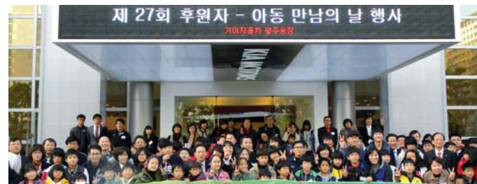
제 27회 후원자 - 아동 만남의 날 행사. 26일 기아차광주공장에서 열린 '2011 후원자-결연아동 만남의 날' 행사 후 후원자들이 결연아동들과 기념촬영을 하고 있다.

기아자동차 광주공장(공장장 김중웅) 임직원들이 릴레이 사랑나눔 봉사활동을 벌였다. 서울과 카렌스를 생산하는 광주1공장은 지난 25일 오후 7시부터 5시간여 동안 광주시 광산구 무억회관 웨딩홀 연회장에서 홀로 사는 노인 난방유 지원을 위한 사랑나눔 호프데이를 열었다. 이날 행사에서 기아차 임직원과 지역 주민들은 모두 1000여만원의 모야 참가요양원에 전달했다. 참가요양원은 광산구 임곡·삼도·본량 등 농촌지역의 홀로 사는 노인 45명의 난방비 지원에 사용할 예정이다. 광주1공장은 지난 2007년부터 매년 일일호프를 열어 홀로 사는 노인들을 돕고 있다. 이들은 또 다음달 17일 참가요양원에서 김장도 담급 예정이다. 스포티지과 서울을 생산하는 광주2공장은 26일 자매결연을 맺은 용진육아원, 사랑의 종집, 즐거운 집 등을 방문해 김장 담그기 봉사활동을 했다. 이들은 총 1400포기(1000만원 상당)의 겨울나기 김장을 담갔다. 봉고트럭과 대형버스, 군수용 차량을 생산하는 광주3공장은 26일 장애인복지시설인 예수마리아요셉 부활의 집을 방문해 장판 교체와 도배 등 오래된 건물의 내부 수리와 환경개선 작업을 했다. 광주3공장은 다음달 10일 지적장애인시설인 예일의 집과 곡성 삼강원을 찾아 김장담그기 담그기 봉사활동도 할 예정이다. /홍형기·박정욱 기자 redplane@kwangju.co.kr