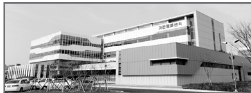
내일 개관 광주테크노파크 가전로봇센터 가보니