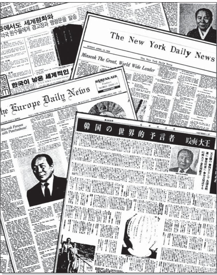
미국, 유럽, 일본 등 전세계 언론에서 민석선생을 소개한 신문기사

2011. 11. 1일에 개봉하려는 심판주의 명에 따라 11, 1일 개봉한 결과 38년전에 작성한 본 결심서에는 2011년 10월, 나의 명을 거역한 카다피의 최후를 보여 주겠다는 심판주의 말씀과 함께 영남장라카엔 내가 그랬듯이 재산의 90%를 사회에 환원하라는 하나님(심판주)의 명령이 담겨있었다.