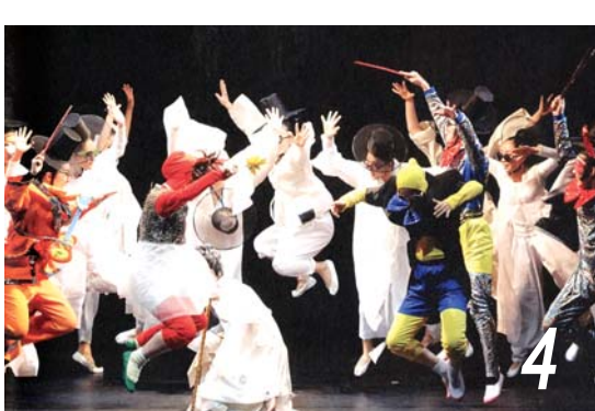
공연문화에 흠뻑 빠지다 4 페스티벌 오! 광주