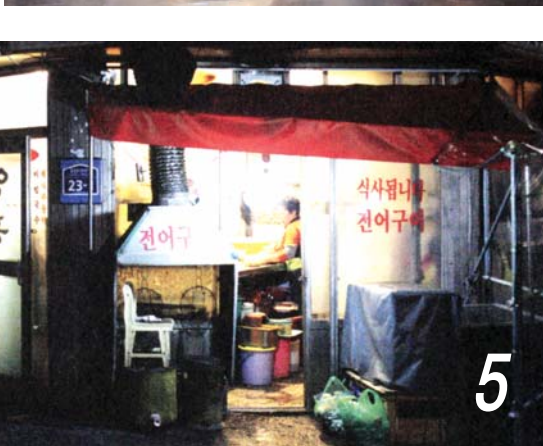
예술인들의 문화사랑방 5 영흥식당