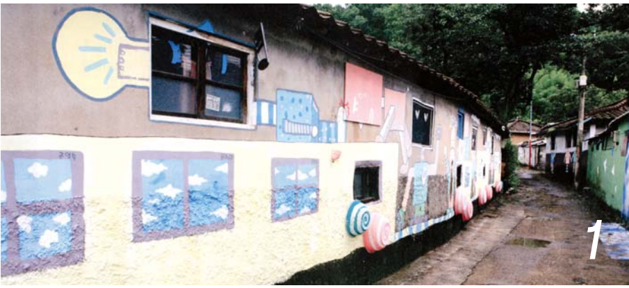
살이있는 골목미술관 1 시화문화마을