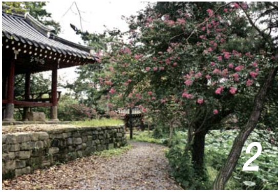
김덕령의 노래가 들려온다 2 취가정