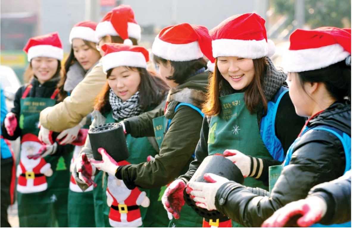
북구청 직원 연탄배달. 광주시 북구청 제17기 청년간부회의 회원들과 기획조정실 직원들이 18일 오후 1년 동안 다독식을 화분 등을 팔아 모은 기금으로 연탄을 구입해 북구 용봉동 영세민들에게 배달하고 있다.