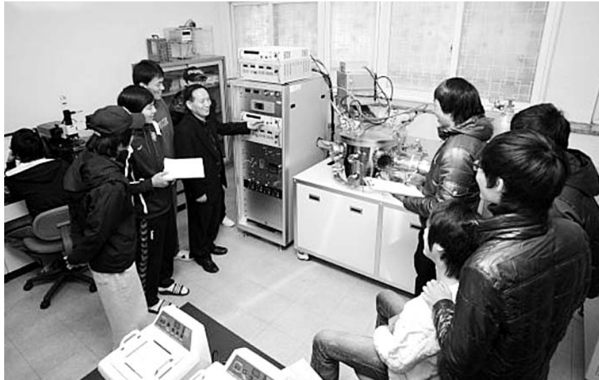
한국폴리텍V대학 신소재응용과 2학년생들이 교수의 지도를 받으며 실습을 하고 있다.

◇대학특성화로 기술변화에 적극 대처 =산업현장의 고도화와 융합화로 단순 기능인력 보다는 현장실무에 능한 기술인력의 수요가 증가되고 있는 추세이다. 이러한 요구에 부응하기 위해 한국폴리텍V대학은 개설학과 전체를 융합학과로 개편했다. 융합학과는 유사학과를 통합하고 학과별로 '세부전공제'를 도입해 전공분야의 전문성과 몰입도를 향상시켰다.