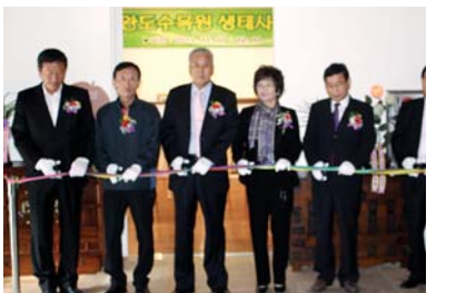
완도군 은퇴 공무원이 20여 년간 카메라 앵글에 담아 온 관내 아름다운 자연 풍광을 선보이는 전시회를 열어 화제다.