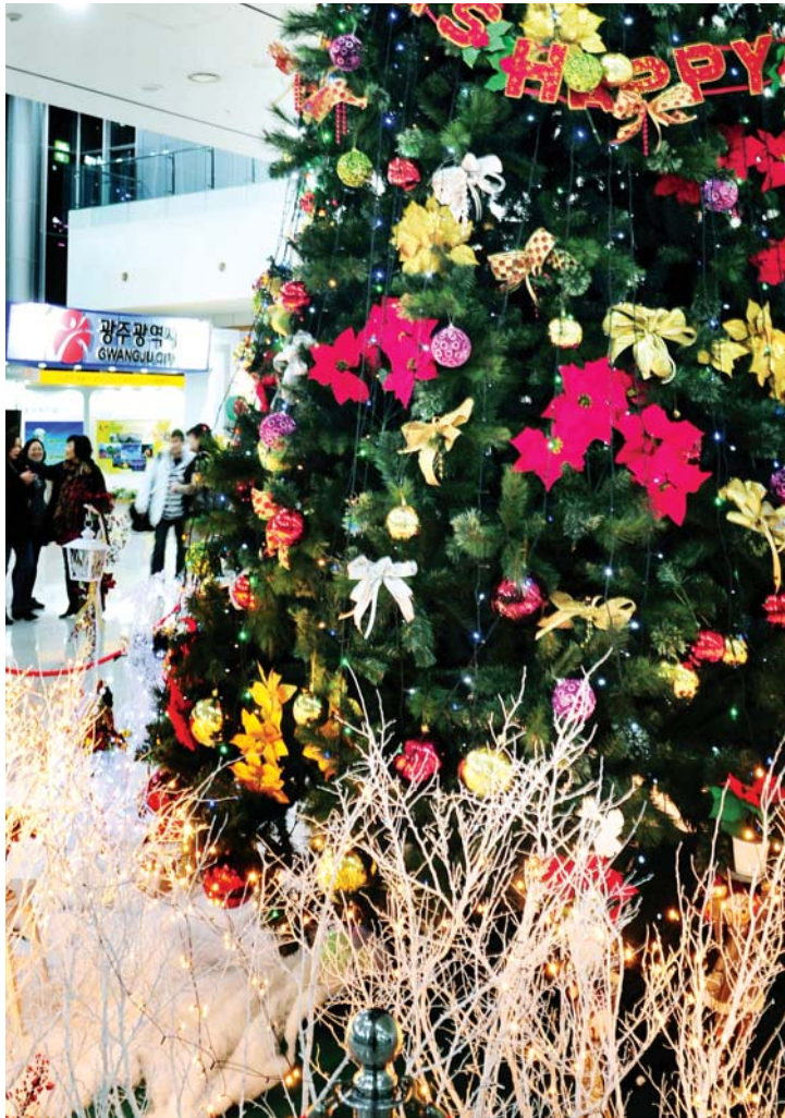
광주 김대중컨벤션센터가 성탄절을 앞둔 22일 센터 중앙에 세운 대형 트리가 반짝거리고 있다.

예년 같으면 대부분의 아파트들도 단지 입구를 다양한 색깔의 전구와 안개등으로 장식했지만 올해는 이마저도 찾기 힘들다. 또한 아이들을 위해 아파트 거실에 미니 트리를 놓는 집도 거의 없다.