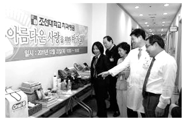
조선대치과병원 사랑의 바자회

전남대학교병원(병원장 송은규)이 최근 '2011 사랑의 나눔을 위한 송년의 밤'을 개최했다. 의과대학 명확홀에서 열린 이번 행사에는 의료진과 직원·환자·시민 등 1000여명이 참가했으며, KIA 타이거즈 김선빈 선수와 삼동섭 선수가 산타모자를 쓰고 특별출연해 참가자들의 환영을 받았다. 크리스마스 캐롤과 축하 공연으로 식전행사를 가진 이날 행사는 송은규 원장의 개회선언에 이어 직원들의 장기 자랑으로 관객들과 함께 웃음꽃을 피웠다.