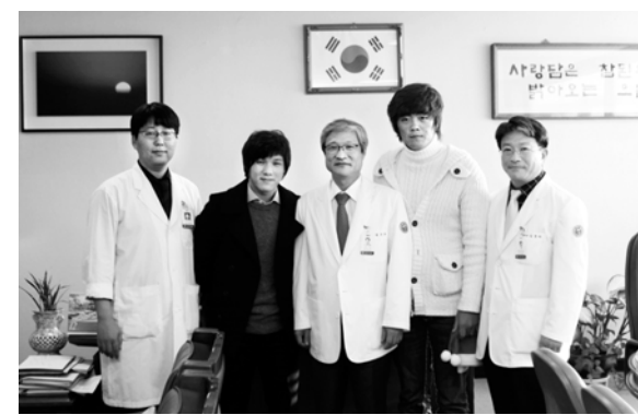
전남대병원 '나눔 송년의 밤'

2004년 개원 이후 7년만에 첫 도전으로 패기를 이뤘다. 화순전남대병원은 2010년 국제의료기관평가(JCI) 인증, 2011년 보건복지부 인증 의료기관 선정 등 국내·외 의료기관평가 인증을 획득했고, 6대급 수술건수 실적에서도 수도권 초·대형병원과 어깨를 나란히 하는 등 경쟁력을 갖춘 병원으로 공식적으로 인정받게 됐다. <채희종기자 chae@kwangju.co.kr>