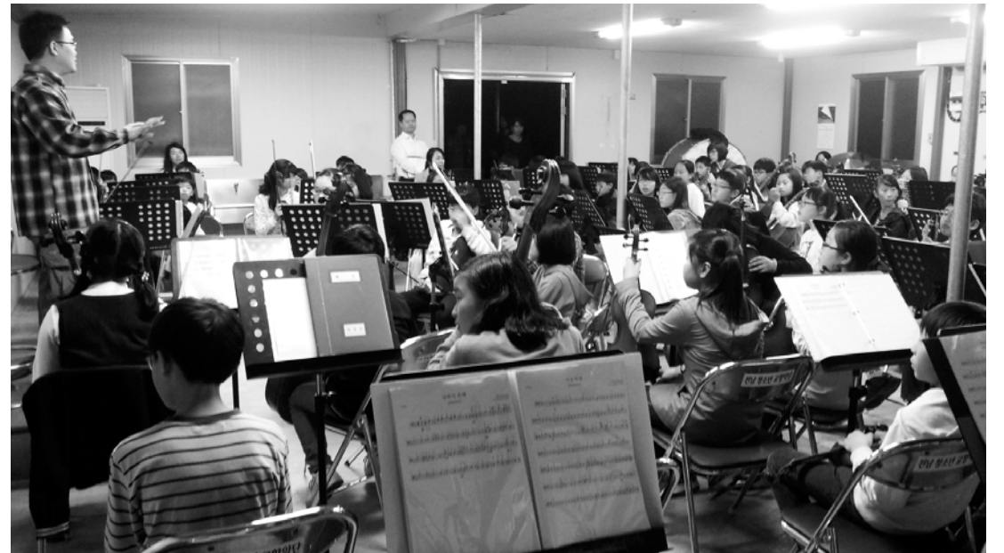
한국판 '엘 시스템아' 초록우산 드림오케스트라 단원들이 26일 철거가 진행 중인 옥남 초교 급식실에서 연수를 하고 있다.

한국판 '엘 시스템아'로 전곡적인 반향을 불러일으킨 '초록우산 드림 오케스트라'(이하 드림 오케스트라)가 연습 장소를 잃고 길거리로 내몰릴 위기에 처했다. 드림오케스트라는 그동안 목포시 옥암동의 폐교된 옥남초등학교 급식실에서 매주 월·목요일 110여 명의 아이들이 모여 3시간씩 연수를 해 왔다. 하지만 이곳은 교육청 연수시설이 들어서게 되는 곳으로, 최근 철거 작업이 시작되면서 운동장의 나무들이 뽑히고 건물 앞 일부 시설물도 파헤쳐진 상태다. 수돗물도 끊겨 연습 때 어려움을 겪는 등 업무실현에 마땅히 오갈 곳이 없어 주위를 안타깝게 하고 있다. 드림 오케스트라는 불우 아동을 돕는 단체 '초록우산 어린이재단' 전남지역본부가 지난 10월 목포시·신안군지역 보육시설 어린이 35명을 모아 첫 발을 내딛었다. 단원들은 보육원 아이들과 지역 아동센터(공부방)에 다니는 저소득층 어린이, 조손(祖孫) 가정과 한부모 가정 자녀 등 모두가 소외계층 아이들이다. 지난 8월 추가 단원 모집을 거쳐 지금은 110명의 아이들이 현악기와 관악기 등 14종류의 악기를 배