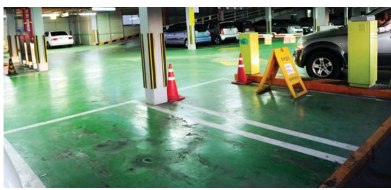
광주 동구청이 직영하는 호남동 공용주차장. 이용차량이 적어 썰렁하다.

2009년 사이에도 수익성이 낮다는 이유로 민간업체가 두 차례나 위탁운영을 중도포기 했다. 다행히 2010년에는 민간업체와 운영 계약이 맺어져 1225만원의 수익을 올리고 있다.