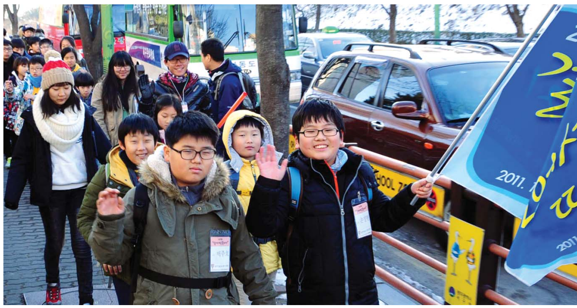
걸어서 땅끝까지... 광주YMCA의 도전캠프 '걸어서 땅끝까지'에 참여한 초·중·고교생 30명이 27일 오전 광주 서구문화센터를 출발하고 있다. 이들은 5박6일 동안 127km를 걸어 해남 땅끝에 도착, 새해 햇빛을 한다.