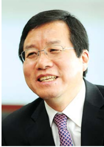
재해·재난 발생 편 현장찾아 세정지원

“세계경제의 저성장 기조와 남유럽으로부터 촉발된 국가 재정위기 등으로 인해 납세자들의 경제여건이 어느 때 보다 어려울 때 영세납세자와 성실 중소기업들이 세무조사에 신경쓰지 않고 생업에 전념토록 세정지원을 하는 ‘납세자중심’ 행정을 펼치겠습니다”