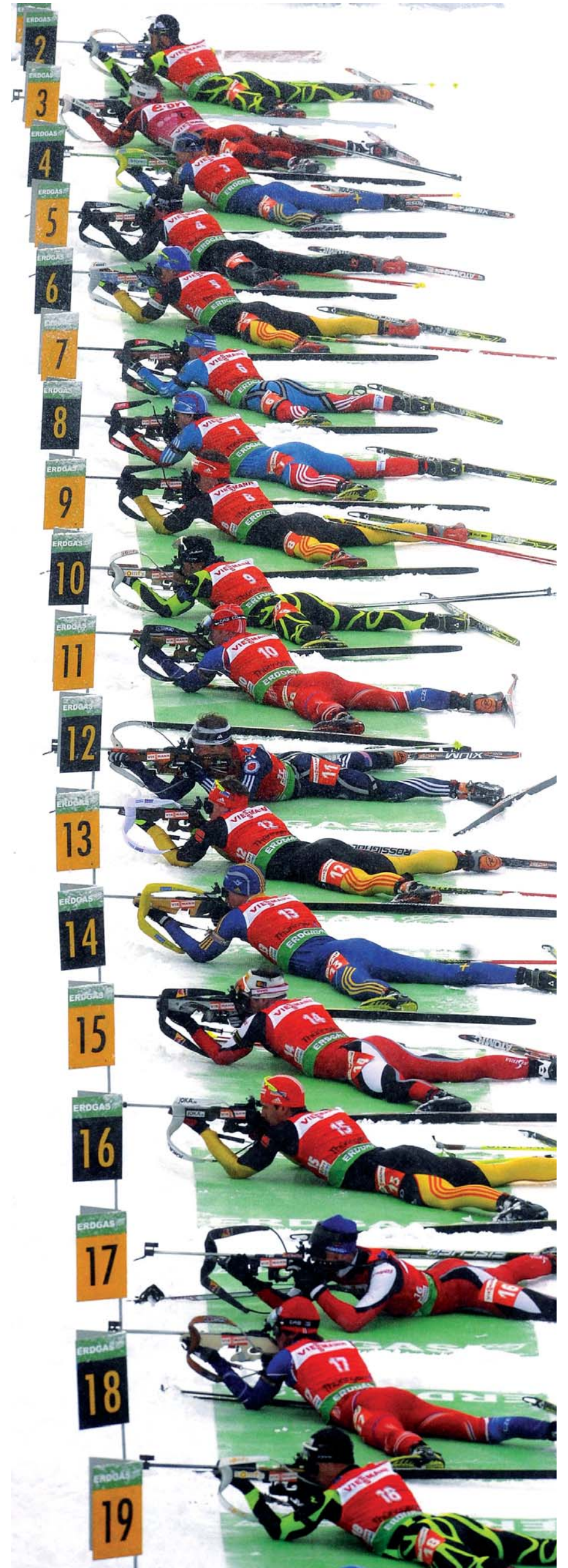
9일 독일 오버호프에서 열린 세계 바이애슬론 월드컵 남자 15km 단체 출발에서 참가 선수들이 사격을 실시하고 있다.