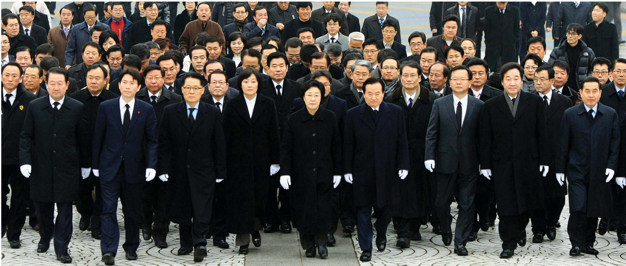
“광주는 정권교체 진원지” 19일 광주를 방문한 민주통합당 한명숙 대표와 최고위원 등 신임 지도부가 참배를 위해 광주 북구 운정동 국립 5·18 민주묘지에 들어오고 있다. >관련기사 2면